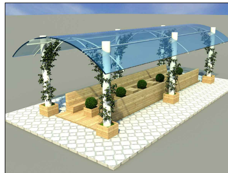
MODELO DE COBERTURA DE ILHA DE LAZER CENTRAL DO CALÇADÃO S/ ESCALA