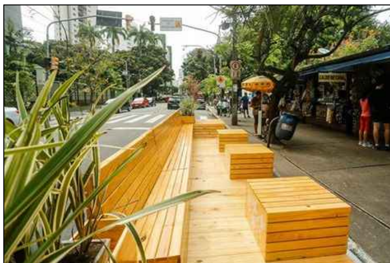
MODELO DE ILHA DE LAZER CENTRAL DO CALÇADÃO S/ ESCALA